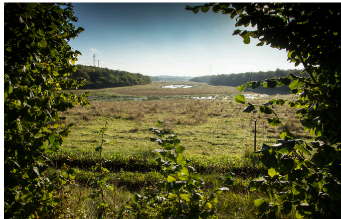
B: Tungegårdsgrøften set mod øst. Der er parkeringsmulighed ved Skenkelsø Mølle, Tungegård Skovbørnehave, hundeskoven ved Birkemosen og i den nordlige del af skoven.

Stenløse-Ølstykke Morænelandskab består af en bølget moræneflade, der afgrænses af de lave dalstrøg omkring Stenløse Å, Værebros Å og Skenkelsø Sø. Området domineres af byområderne Ølstykke Stationsby og Stenløse-Gl.Ølstykke, der ligger tæt langs en øst-vestgående akse og næsten danner et sammenhængende bybånd.